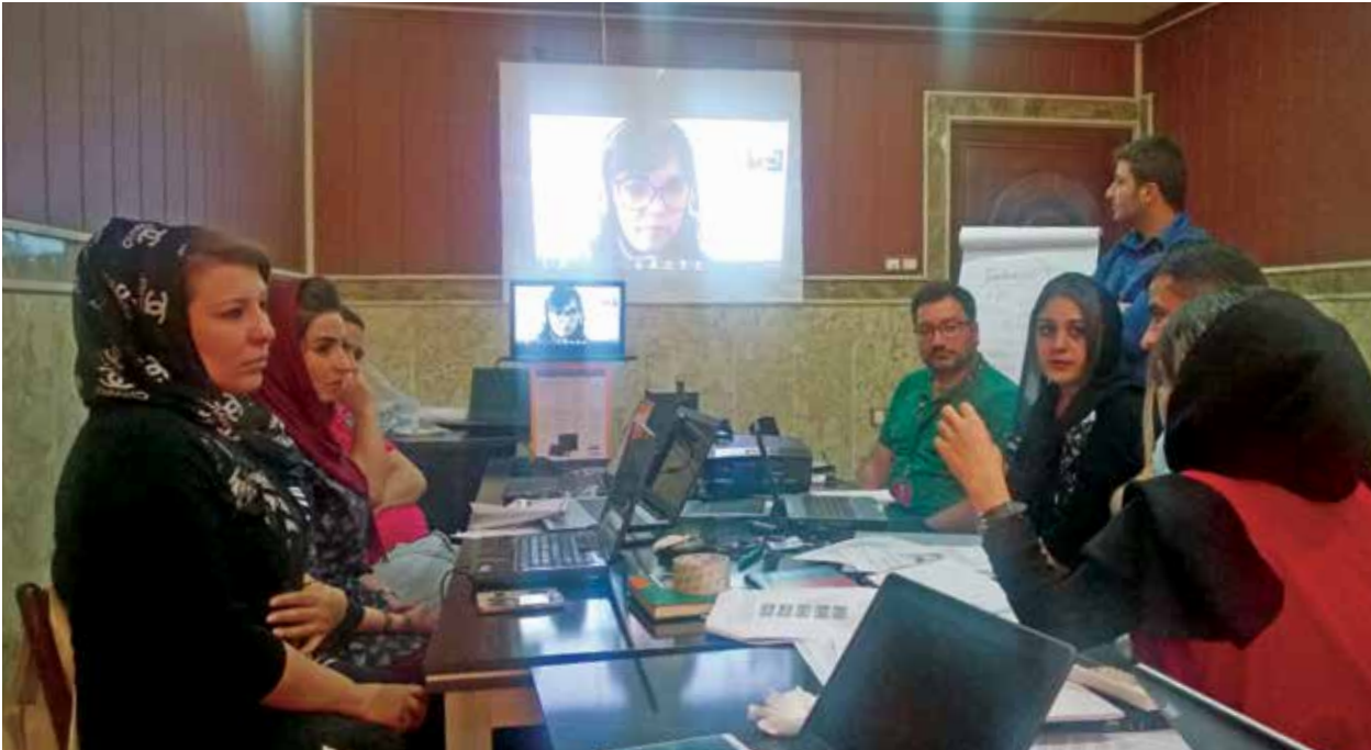
برنامج اللغة من أجل التكيف لتدريب المدرسين التجريبي في المناطق النائية في كردستان العراق.