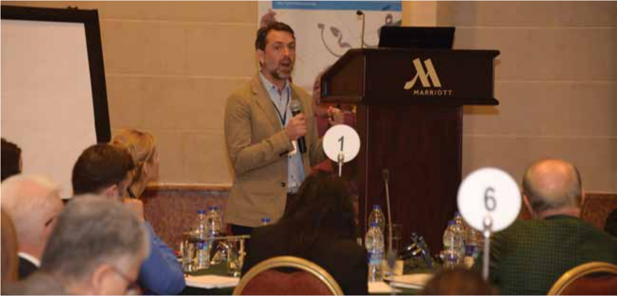
مؤتمر في مخيم الزعتري: اجتماع حوارى ناقش الأفكار المنبثقة عن دراسة دور اللغة في تحسين التعافي عند مجتمعات اللجوء السورية والبلدان المضيفة للجئين.