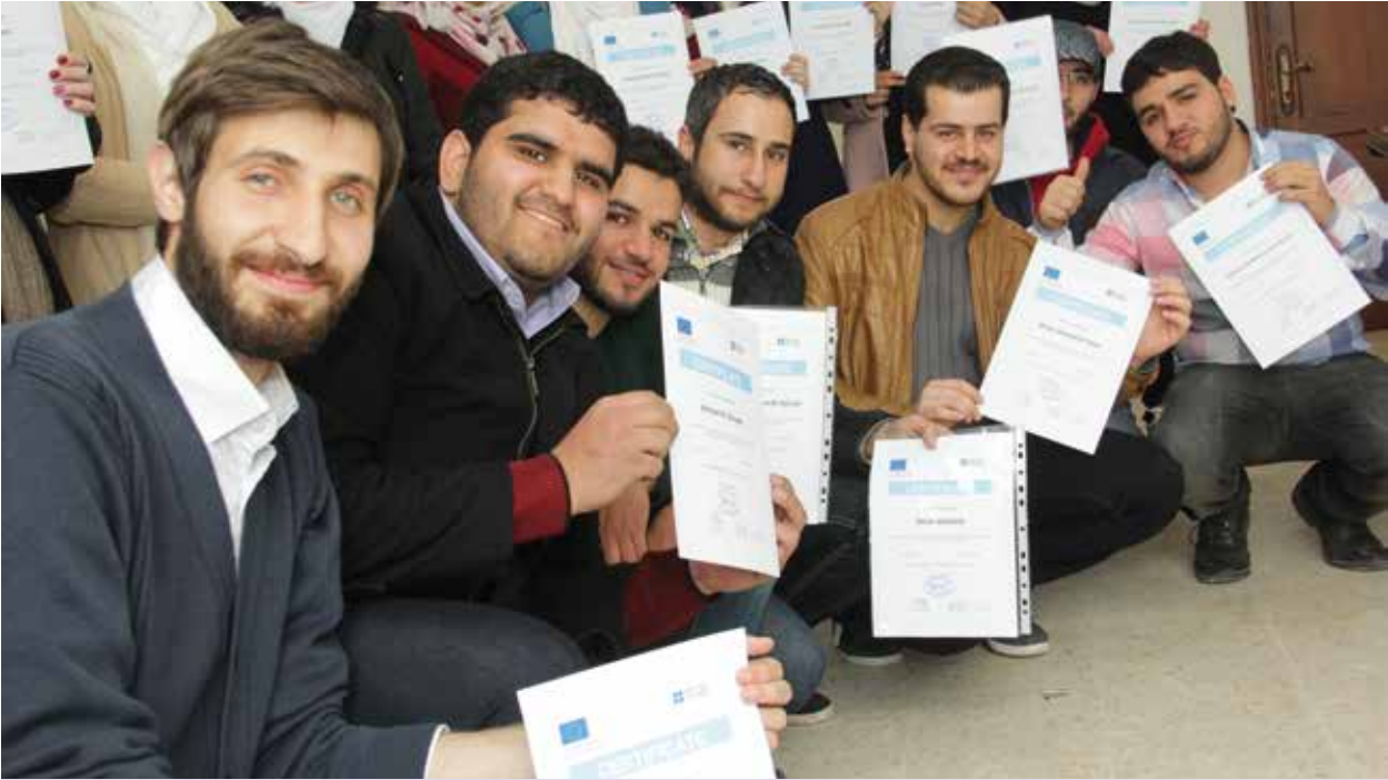
مشروع تعليم اللغة والمهارات الأكاديمية وموارد التعليم الإلكتروني: دعم الطلاب السوريين المهجرين والشباب المحرومين في الأردن ولبنان وسوريا لإعادة دمجهم في برامج التعليم الأعلى.

دراسة حالة: الحصول على التعليم – برنامج لغوي تكاملي للأطفال السوريين اللاجئين (المجلس الثقافي البريطاني، لبنان)