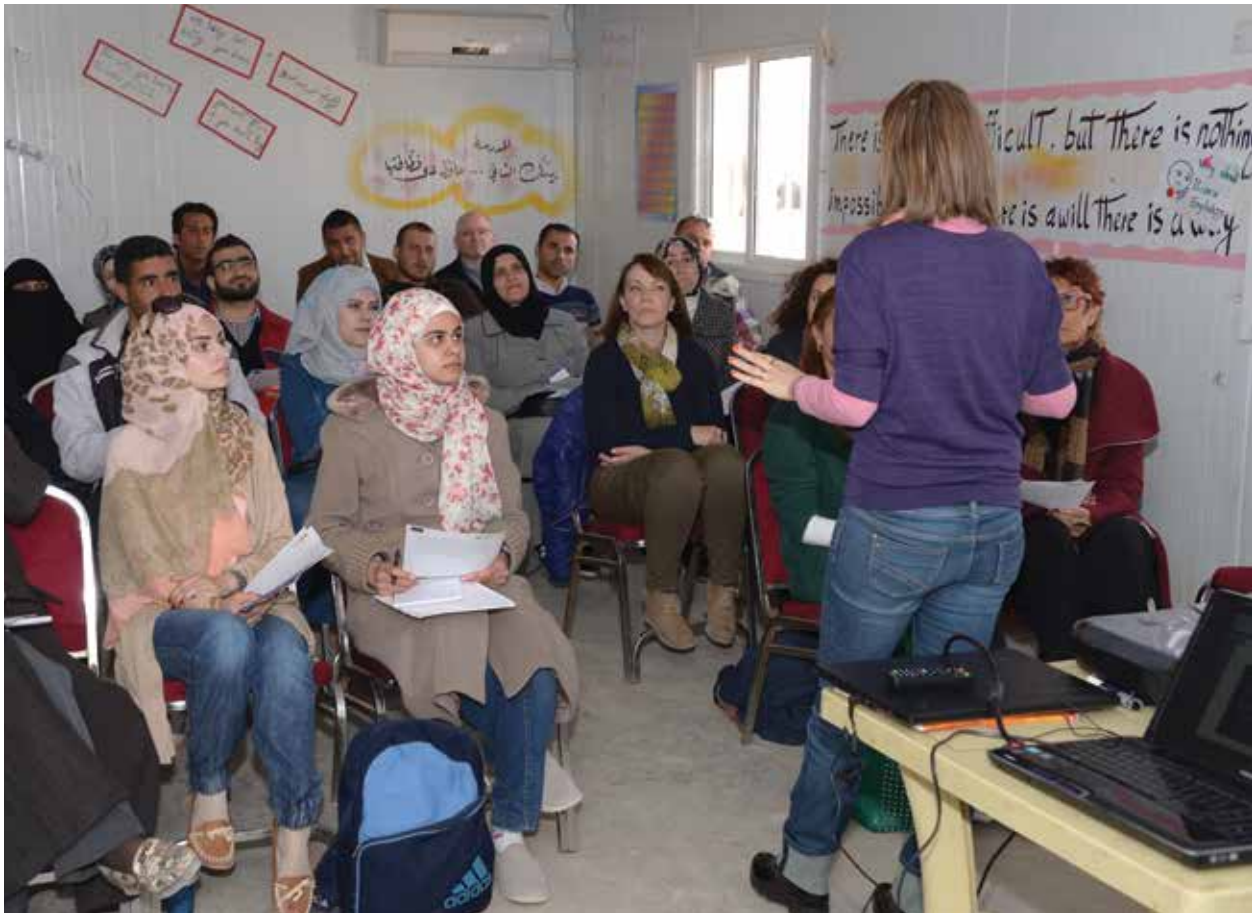
الصورة لمؤتمر في مخيم الزعتري (دور اللغة في وقت الذمات)- حيث ناقش التحديات والدروس الناتجة عن تقدم برامج تعليم اللغة للمجتمعات السورية المهجرة.

ففي البلدان الأربعة، الحاجات كانت كالتالي: